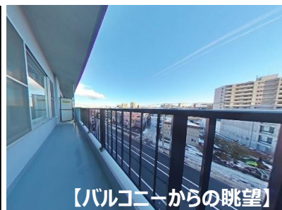
【バルコニーからの眺望】