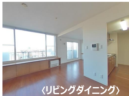
〈リビングダイニング〉